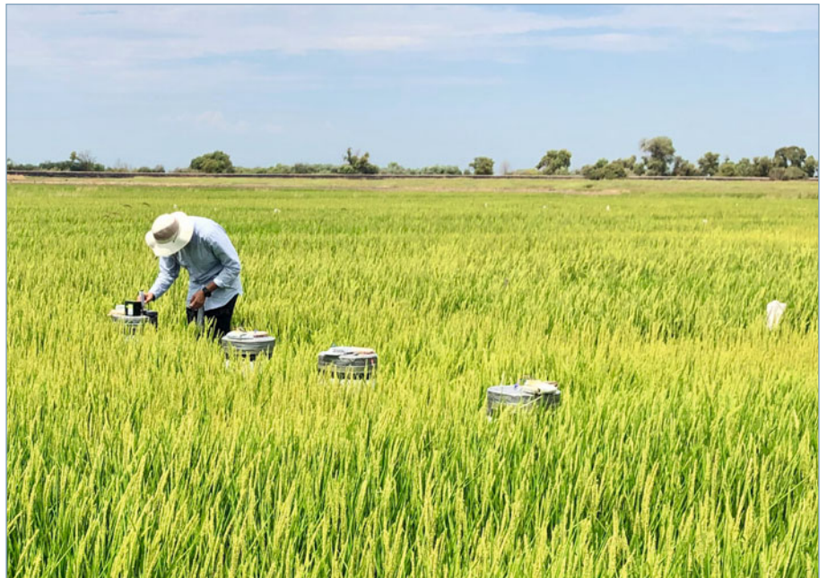
▲ Abb. 2: Aktuell laufender Feldversuch in einem Reisfeld in den USA, in dem versucht wird, die Abundanz und Aktivität der Kabelbakterien zu stimulieren. Im Bild zu sehen sind vier Messkammern zur Bestimmung der Methanemissionen verschiedener Behandlungen.

Über ihre elektrische Verbindung erhöhen Kabelbakterien letztlich die indirekte Verfügbarkeit von Sauerstoff als Elektronenakzeptor im Sediment und geben Raum für eine elektrische Biosphäre, in der so eine Vielzahl interessanter mikrobieller Interaktionen und Prozesse möglich wird. So wurde bereits früh gezeigt, dass Kabelbakterien in saisonal suboxischen Wasserkörpern als Brandmauer entgegen einer übermäßigen Freisetzung von toxischem Sulfid und Nährstoffen aus dem Sediment wirken [5]. In der durch die Kabelbakterien gebildeten suboxischen Zone sind zudem viele sonst sauerstoffabhängige mikrobielle Aktivitäten und Populationen stimuliert [6]. Möglicherweise können also Kabelbakterien auch durch andere Mikroorganismen als Elektronenakzeptor, zumindest aber als Elektronensenke genutzt werden. Diese Aspekte sind äußerst relevant in der Diskussion der Anwendungspotenziale dieser Mikrobe des Jahres.