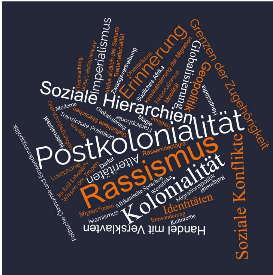
Abbildung 4: Zentrale Themen aus Master- und Doktorarbeiten des POSAFRO-Programms (Darstellung der Autorinnen).

So zeichnet sich trotz aller Herausforderungen ein Kompass in Richtung Zukunft ab, wenn man die Abschlussarbeiten aus den vergangenen Jahren im POSAFRO-Programm betrachtet. Diese stützen sich inzwischen auf zahlreiche afrikanische und afrolateinamerikanische Quellen und sind nicht mehr vornehmlich von US-amerikanischen und europäischen Theorieentwürfen abhängig. Die in Abbildung 4 dargestellte Wortwolke mit zentralen Themen aus aktuellen Master- und Promotionskommissionen im CEAO veranschaulicht, wie grundlegend sich der Horizont der brasilianischen Afrikastudien erweitert hat. Dies wird auch an Publikationen wie dem Dicionário das relações étnico-raciais contemporâneas (Rios, Santos und Ratts 2023) deutlich, in dem Konzepte zu Diskriminierung und Rassismus von brasilianischen und lateinamerikanischen Spezialist*innen aus historisch diskriminierten Gruppen dargelegt werden (speziell Frauen, Schwarze, indigene und jüdische Menschen). Darüber hinaus wurde das wissenschaftliche Journal des CEAO, die Revista Afro-Ásia , im Begutachtungszeitraum 2017-2020 vom brasilianischen