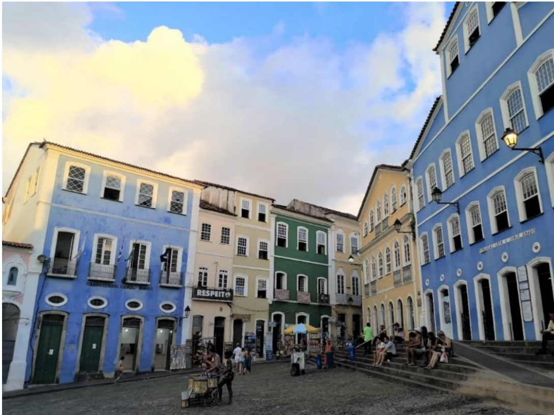
Abbildung 2: Theatralisiertes UNESCO-Weltkulturerbe Pelourinho in Salvador da Bahia (Gruber 2022).