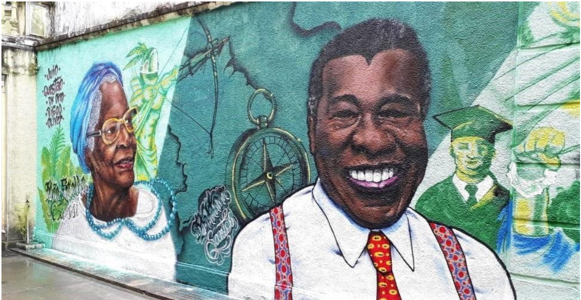
Abbildung 3: Graffiti anlässlich des 60-jährigen Jubiläums des CEAO ( https://ceao.ufba.br/mural-grafitado-no-ceao ).