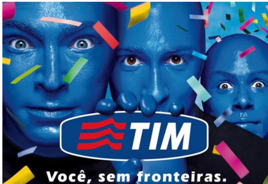
Abbildung 1: Kontroverser Werbeauftritt ‚Du, ohne Grenzen‘ ( https://maisro.com.br/wp-content/uploads/2015/10/tim2.jpg ).

Sichtbarmachung moralisch meist negativ konnotiert. Zudem sind Schwarze Brasilianer*innen in politischen und wirtschaftlichen Sphären der Macht nach wie vor stark unterrepräsentiert.