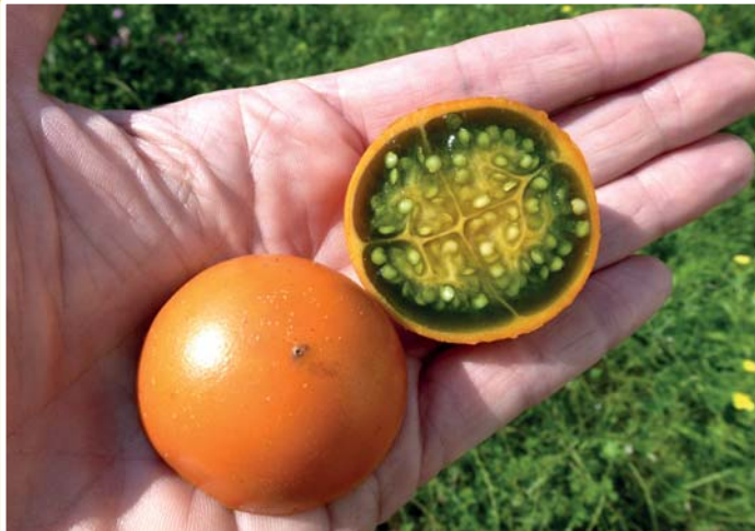
Quer aufgeschnittene Lulo-Frucht mit oranger Schale und grün-gelblichem Fruchtfleisch. Die Farbstoffe wurden in Kooperation mit dem Lehrstuhl für Bioanalytik und Lebensmittelanalytik der UBT identifiziert und quantifiziert.

der Lulo könnten Schädlinge wie Wollläuse sein. Eine Studie im Tropenhaus Klein-Eden in Kleintettau ergab, dass die Lulo in Mischkultur mit Papaya kultiviert werden kann. Maßnahmen zur Ertragssteigerung und zum Schädlings-