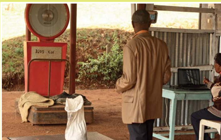
Ein Kleinbauer gibt seine Kaffeeernte bei einer Kooperative ab.

Kaffee ist in Europa Bestandteil unserer täglichen Routine. Dennoch wissen wir viel zu wenig über die Anbaubedingungen und die Menschen, die in diesen Anbau involviert sind. Eine Ausstellung im Ausstellungsraum des ÖBG vom Früh-