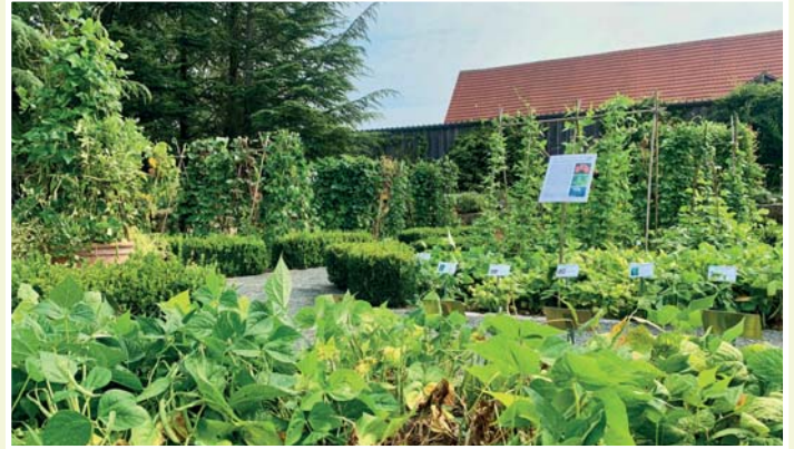
Hülsenfrüchte im Nutzpflanzengarten

auf der Mediterranpflanzenfläche, über Vertreter dieser Familie im Freiland wie Robinie und Süßholz, bis in den Nutzgarten. Dort sind über 120 Arten und Sorten essbarer Hülsenfrüchte aus aller Welt aufgepflanzt. Alle vorgestellten Pflanzen sind mit