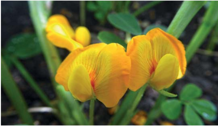
Blüten der Erdnusspflanze

Hülsenfrüchte sind auch 2021 der Schwerpunkt im ÖBG: Im Rahmen des zweijährigen Themas gibt es einen Informationspfad durch den Garten. Dieser führt von den tropischen Leguminosen, wie Gummi-Akazie, Erdnuss und Johannisbrot