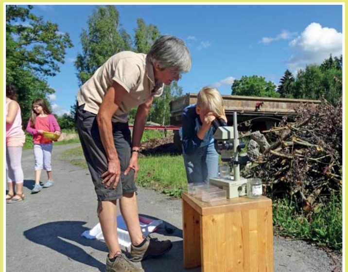
Die Welt entdecken und verstehen lernen: Unsere Projekte im Rahmen der Bildung für nachhaltige Entwicklung (BNE) vermitteln naturwissenschaftliche Themen spielerisch und abwechslungsreich. Nun wurden wir als zertifizierter Partner im Netzwerk „Umweltbildung.Bayern“ mit einem Qualitätssiegel ausgezeichnet.

Partner des Netzwerks „Umweltbildung.Bayern“ mit dem Qualitätssiegel ausgezeichnet. Weitere Infos zum Umweltsiegel unter www.umweltbildung.bayern.de und zu unseren Bildungsangeboten auf www.obg.uni-bayreuth.de JM