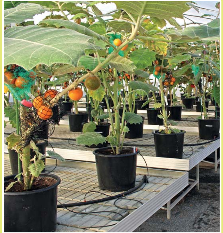
Versuchsaufbau mit Lulopflanzen im ÖBG. Ertrag und Fruchtqualität wurden erfasst und analysiert.

trags umfassend charakterisiert und neue Erkenntnisse u.a. zu den Fruchtfarbstoffen, gewonnen werden. Die Lulo wird in Lateinamerika mit verschiedenen Lokalvarietäten angebaut, von denen wir einige untersucht haben. Es ergaben sich z.T. deutliche Unterschiede in den o.g. Eigenschaften, die für den Anbau und die Züchtung verbesserter Sorten in Zukunft von internationaler Bedeutung sind. Ein Problem im Anbau