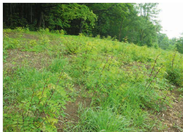
Abbildung 13: Von Altbäumen am Waldrand sich weit ausbreitende Wurzelbrut

haben eine harte, wasserundurchlässige Schale, die zunächst zwar eine Keimhemmung verursacht, aber auch eine lange Keimfähigkeit ermöglicht. Im Boden kann sich deshalb eine Samenbank bilden. Die Samen können noch nach Jahren bei geeigneten Umweltbedingungen keimen, z. B. nach Störungen des Bodens. Keimlinge brauchen für ihr Wachstum ausreichend Licht, erfolgreich etablieren sie sich deshalb nur auf vegetationsarmen oder -freien Böden (Rohböden).