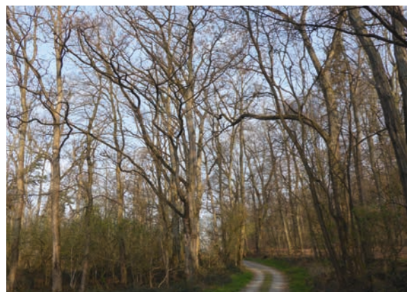
Abbildung 2 (oben): Robinien am Dom von Lund in Schweden