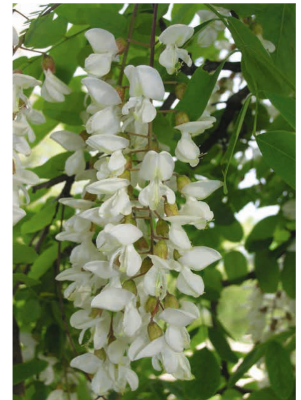
Abbildung 10: Blütentrauben

Robinia pseudoacacia verfügt über eine enorme Reproduktions- und Regenerationsfähigkeit sowohl sexuell via Samen als auch vegetativ durch Stockausschläge und Wurzelsprosse. Robinien können schon im Alter von sechs Jahren blühen. Regelmäßig und üppig alle ein bis zwei Jahre blühend (Abbildung 10)