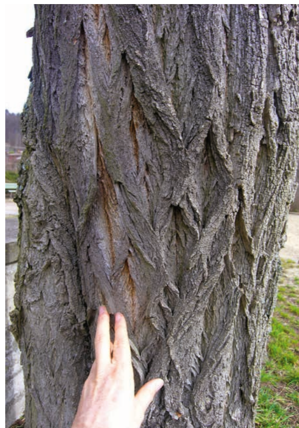
Abbildung 4: Robinien bilden im Alter eine dicke, tief längsgefurchte Borke.

Ein bemerkenswertes Phänomen vor allem junger Robinien ist ihre Fähigkeit zur aktiven Bewegung der Fiederblättchen. Bei starker Sonneneinstrahlung klappen die normalerweise waagrecht orientierten Fiederblättchen mehr oder weniger stark nach oben (Abbildung 7), mutmaßlich um Schäden durch starke Strahlung zu vermeiden. Rätselhafter sind die »Beweg«gründe für die nächtliche Schlafstellung der Blätter (Abbildung 8), bei der die Blättchen entlang der Mittelrippe (Rhachis) schlaff nach unten klappen, was auch von vielen anderen Hülsenfrüchtlern bekannt