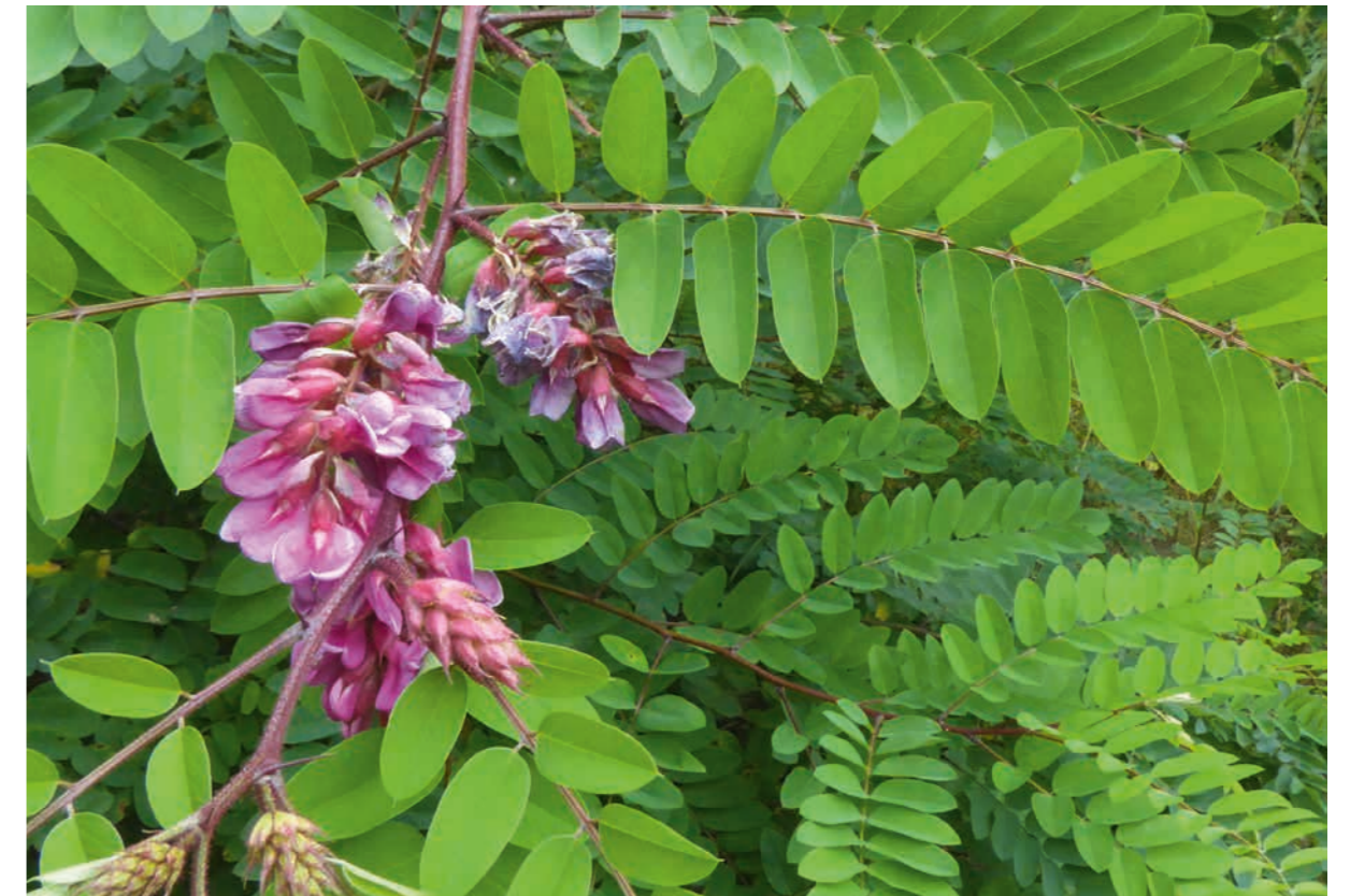
Abbildung 1: Robinia viscosa , die Klebrige Robinie, eine bei uns gelegentlich kultivierte rötlich blühende Robinienart. Ihren Namen hat sie aufgrund ihrer drüsig-klebrigen Sprosse, Blatt- und Blütenstiele.

Robinia pseudoacacia kann im Freiland bis 20 m, in Waldbeständen bis 30 m hoch und bis 1,2 m, in Ausnahmefällen sogar bis 2 m dick werden (BHD, Durch-