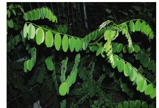
Abbildung 5 (oben links): Die unpaarig gefiederten Laubblätter der Robinie mit den paarigen Nebenblattdornen am Blattgrund