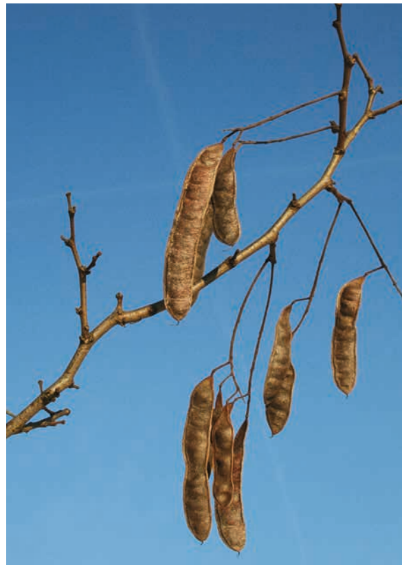
Abbildung 12: Die Hülsenfrüchte bleiben als Wintersteher oft bis ins nächste Jahr am Baum.

haben eine harte, wasserundurchlässige Schale, die zunächst zwar eine Keimhemmung verursacht, aber auch eine lange Keimfähigkeit ermöglicht. Im Boden kann sich deshalb eine Samenbank bilden. Die Samen können noch nach Jahren bei geeigneten Umweltbedingungen keimen, z. B. nach Störungen des Bodens. Keimlinge brauchen für ihr Wachstum ausreichend Licht, erfolgreich etablieren sie sich deshalb nur auf vegetationsarmen oder -freien Böden (Rohböden).