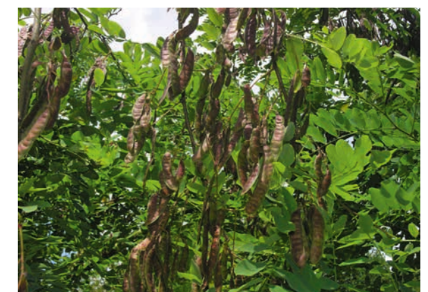
Abbildung 11: Hülsenfrüchte

sind Robinien ergiebige Bienen-tracht-pflanzen. Die Hülsenfrüchte (Abbildung 11) reifen im Herbst, bleiben aber als Wintersteher oft bis ins kommende Jahr am Baum (Abbildung 12). Die Samen werden meist mit den Hülsen durch bloßes Herabfallen (autochor, barochor) oder durch den Wind (anemochor) ausgebreitet, nur selten endozochor durch Vögel. Eine Diasporenausbreitung über größere Distanzen erfolgt sekundär, indem auf dem Boden oder Schnee liegende Hülsen oder Samen durch Wind oder Wasser verfrachtet werden (Cierjacks et al. 2013). Die Samen