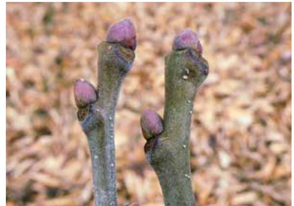
Abbildung 7 (unten): Stockausschläge von Castanea sativa nach einem Waldbrand im südschweizerischen Tessin