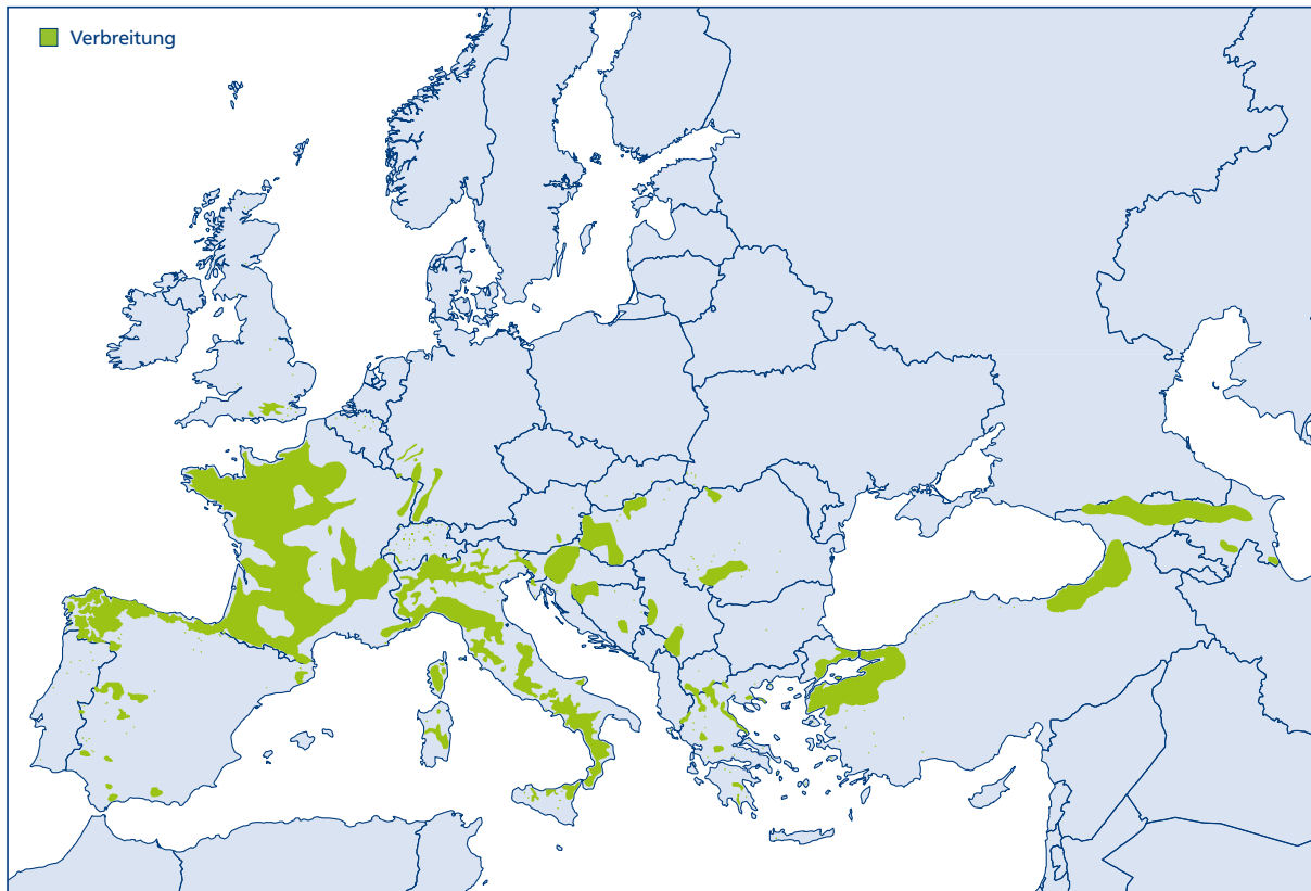
Abbildung 13: Verbreitung von Castanea sativa . Dargestellt ist das natürliche Areal und die Gebiete mit fest eingebürgerten Vorkommen (verändert nach EUFORGEN)

Reinbestände wächst sie in Deutschland insgesamt auf etwa 9.000 ha und damit auf weniger als 0,1 % der Waldfläche, davon alleine in Baden-Württemberg auf 3.700 ha und in Rheinland-Pfalz auf 3.600 ha (BWI3, https://bwi.info/ ). Nördlich und östlich davon kommen Esskastanien nur selten und meist als Einzelbäume vor.