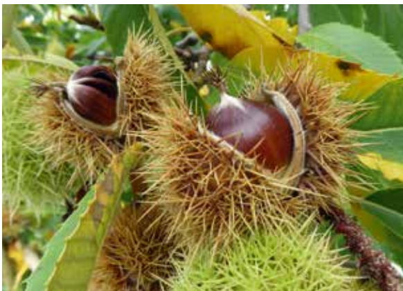
Abbildung 11 (oben): Sommeraspekt einer reichlich fruchttragenden Esskastanie