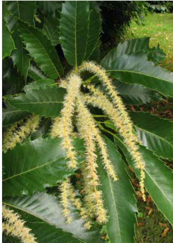
Abbildung 9: Männliche Blütenstände

Esskastanien blühen spät, nördlich der Alpen erst Ende Mai bis Anfang Juni. Die Blüten riechen eher unangenehm nach Trimethylamin, die männlichen produzieren reichlich Nektar. Castanea sativa ist auf Fremdbestäubung angewiesen. Bestäuber sind Insekten, vor allem Bienen, aber auch Käfer. Aufgrund der jahreszeitlich späten Blüte sind Esskastanien eine begehrte Bientrachtanlage und liefern reichlich Honig. Insbesondere bei trockener Witterung trägt aber neben der Entomogamie auch Windbestäubung (Anemogamie) zum Fruchtansatz bei.