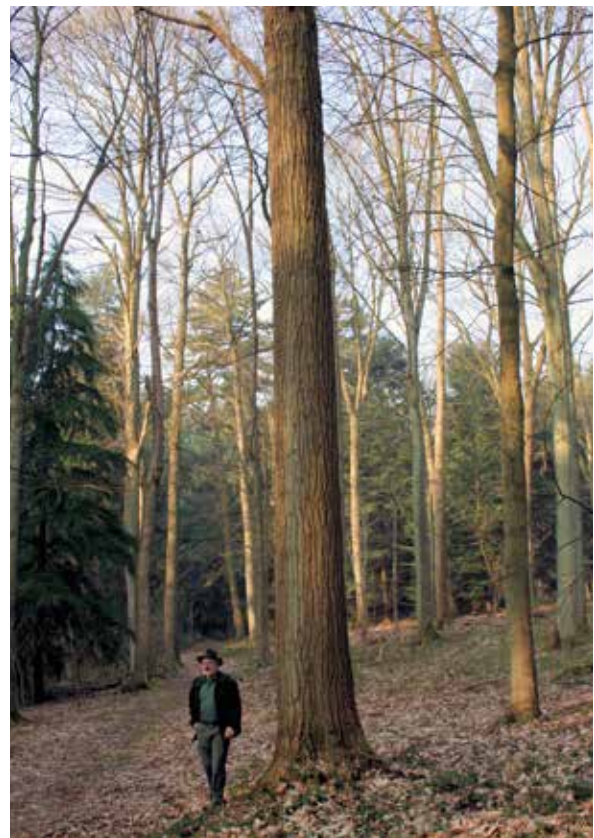
Abbildung 1: Castanea dentata , die Amerikanische Edelkastanie (American chestnut), im Arboretum Tervuren, Belgien

Castanea dentata , die von ihrer europäischen Verwandten nur sehr schwer zu unterscheidende Amerikanische Esskastanie (American chestnut, Abbildung 1), war bis etwa 1930 als »Waldbaum allerersten Ranges« (Schenck 1939) eine der wichtigsten und forstlich bedeutendsten Baumarten im östlichen Nordamerika.