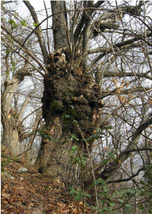
Abbildung 4: Stamm einer alten, zur Fruchtproduktion kultivierten Kastanie in der Südschweiz (Tessin), an der die Veredelungsstelle als knollenartige Wucherung gut zu erkennen ist

Hochsommer weiter wachsen kann. Neben den meist kräftigen und etwas kantigen Langtrieben werden Kurztriebe gebildet. Die Laubblätter (Abbildung 6) sind wechselständig, bei aufrechten Trieben spiralig, bei plagiotropen Zweigen im Schatten hingegen zweizeilig angeordnet. Charakteristisch für Castanea sativa ist das große, derb-ledrige, lanzettliche Laubblatt, das am Rand buchtig und grannenspitzig gezähnt ist.