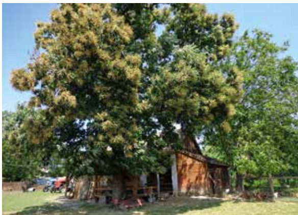
Abbildung 2: Esskastanie als Zeuge einer alten Kultur auf einem Bauernhof in Ungarn

förmig um den meist drehwüchsigen Stamm verlaufen (Abbildung 3a und b). An alten Bäumen ist oft durch auffällige krebsartige Wucherungen am Stamm gut die ursprüngliche Stelle der Veredelung zu erkennen, da Edelkastanien für die Fruchtproduktion oft durch Pfropfung vegetativ als Sorten vermehrt wurden (Abbildung 4).