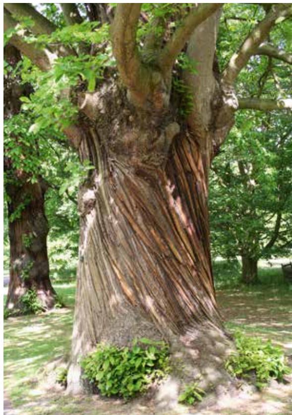
Abbildung 3a und b: Esskastanien mit deutlichem Drehwuchs und der typischen, tief längsrissigen Borke

Das Sprosswachstum von Esskastanien ist dadurch gekennzeichnet, dass im Frühjahr zunächst der in der Knospe vorgebildete (präformierte) Trieb austreibt, dieser danach, kontinuierlich neoformiert, bis in den