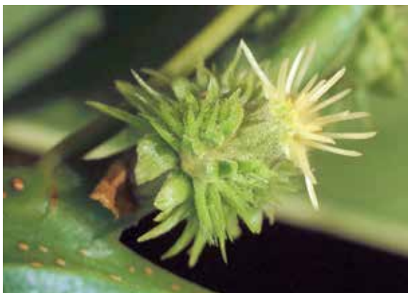
Abbildung 8 (oben): Esskastanie in voller Blüte im Vintschgau, Südtirol