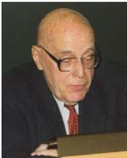
Erster Preisträger des Philosopher's Stone: Dr. Dr. h. c. Hans Albert.

Erster Preisträger der neu geschaffenen Auszeichnung ist Professor Dr. Dr. h. c. mult. Hans Albert. Der 89-Jährige hat im Anschluss an Karl Popper den Kritischen Rationalismus zu einer umfassenden Konzeption entwickelt. In dem berühmt gewordenen Positivismusstreit war Hans Albert neben Theodor Adorno, Max Horkheimer, Jürgen Habermas, Ralf Dahrendorf und Karl Popper einer der Hauptbeteiligten. „Kein