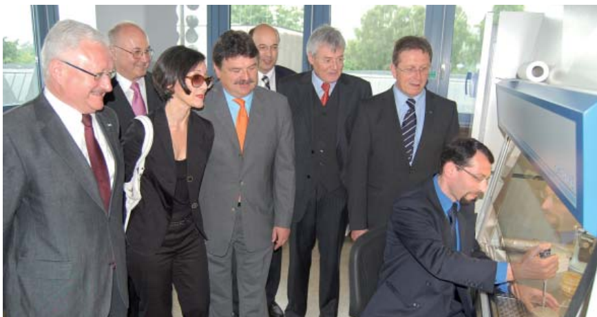
Vertreter aus Wirtschaft, Politik und Verwaltung, vom Max Rubner-Institut und aus den Reihen der Universität Bayreuth eröffneten die neue Forschungsstelle für Nahrungsmittelqualität am Standort Kulmbach.