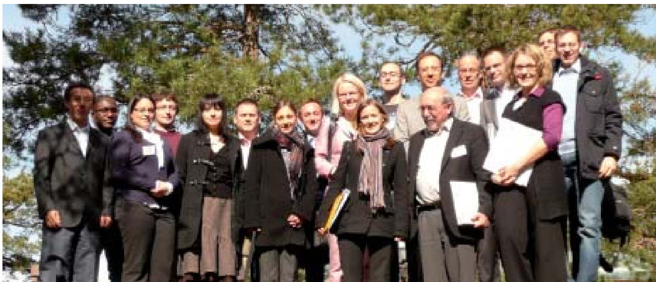
Mitglieder des DFG-Graduiertenkollegs „Geistiges Eigentum und Gemeinfreiheit“ besuchten das Nordic Network Meeting und die Global IP Konferenz in Helsinki.