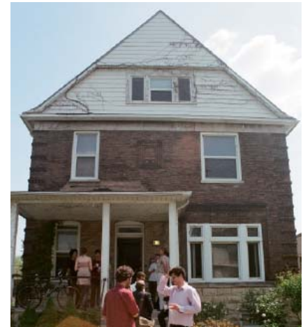
An einem beschaulichen Ort traf man sich zum Workshop „Politics in Africa“.

Für das nächste Jahr ist ein weiteres Kooperationsprojekt zwischen der BIGSAS und dem ethnologischen Institut der Universität Chicago geplant. Dann werden Professoren und DoktorandInnen beider Institutionen für einen Workshop zum Thema „Generationen“ zusammenkommen.