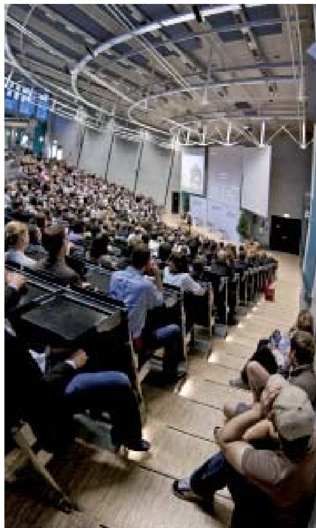
Perfekt organisiert und mit einem hochinteressanten Programm ausgestattet: Der zweite Ökonomie- und Alumnikongress begeisterte mehr als 1100 Besucher.

Interessant war der Kongress auch für Studenten und Alumni aus ganz Deutschland. Denn neben der Möglichkeit, Kontakte zu knüpfen und