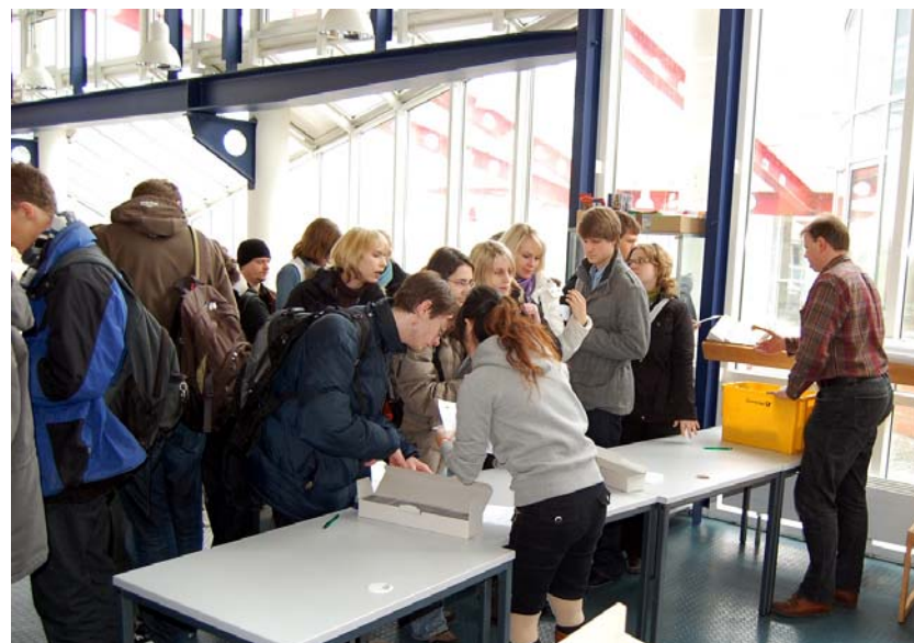
Viel los bei der Ausgabe der Campus-Card. Doch dann war wieder Warten an der Validierungsstation angesagt.

Die viele Funktionalitäten beinhaltende UBT-Campus-Card wird jetzt an die Studierenden ausgegeben. Bereits vor dem offiziellen Ausgabetermin ab 11 Uhr bildeten sich lange Schlangen von Studierenden, die möglichst bald die Karte nutzen wollten.