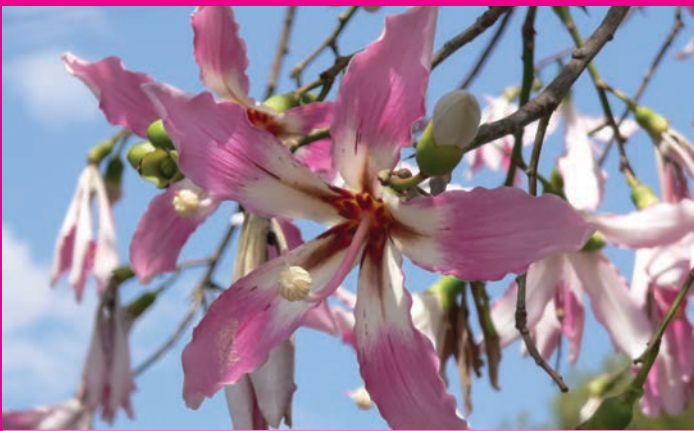
Pflanze eines WM-Favoriten: Blüte des Florettseidenbaums ( Chorisia speciosa ).

Informationen zu diesen und weiteren Fußballnationen und ihren Pflanzen finden Sie den ganzen Sommer über auf der Kübelpflanzenfläche.