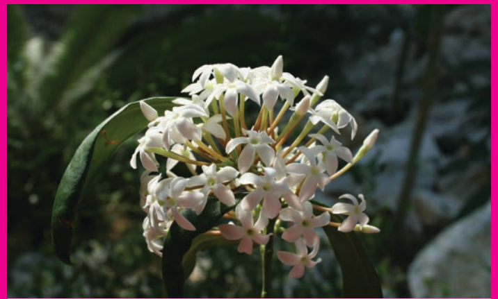
Repräsentant des Gastgeberlandes Südafrika: Der Giftbusch ( Acokanthera oppositifolia ).